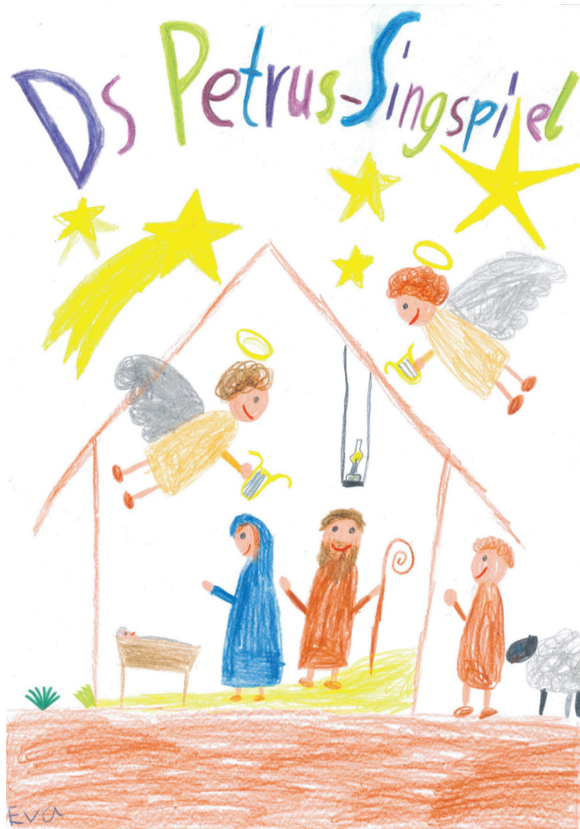
Maria und Josef in Bethlehem.

Für diejenigen Menschen, die nach Eindeutigkeiten oder gar historischen Tatsachen suchen, ist diese Vielfalt an Erzählungen nicht so